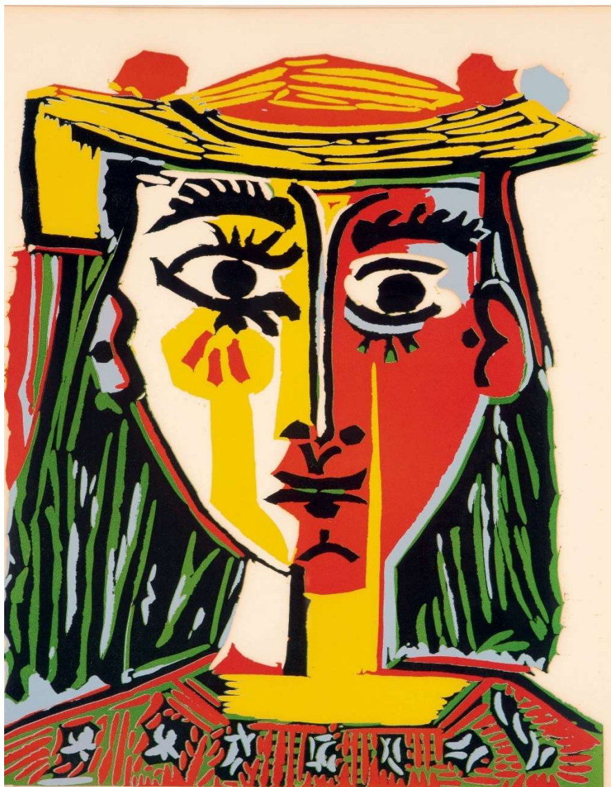
Annexe 1 - Picasso – Buste de femme au chapeau.