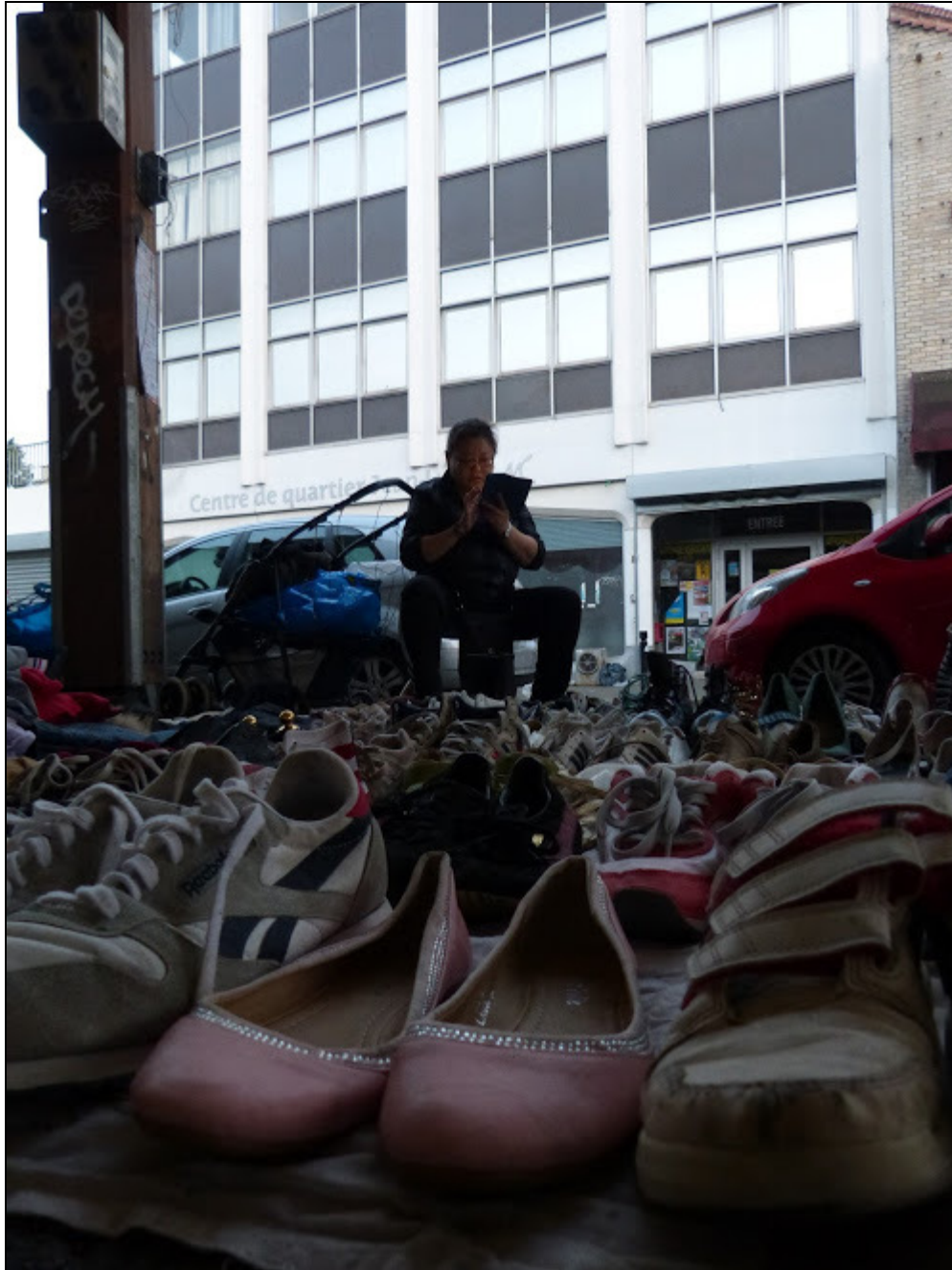
Une vendeuse de chaussures...