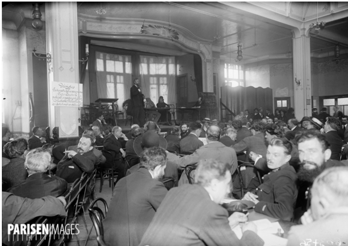
"La Belvilloise", coopérative ouvrière de consommation. Salle de réunion mise à la disposition des grévistes. Paris.